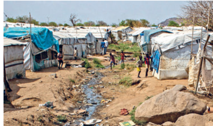
Das Lager der Hauptstadt Juba: Über 35.000 vertriebene Menschen des Südsudan haben hier Zuflucht gefunden. Sie leben unter schwierigsten Bedingungen.

Für den Unterricht haben die indischen Schwestern, die von Caritas international, dem Hilfswerk des Deutschen Caritasverbandes, unterstützt werden, einheimische Lehrer angestellt. In sieben Vor- und drei Grundschulen vermitteln sie mehr als 700 Schulkindern das Rechnen und Lesen, aber auch Praktisches für den Alltag. Ihr Unterricht ist ein Privileg, denn fast zwei Millionen südsudanesischen Kinder haben derzeit keine Möglichkeiten, eine Schule zu besuchen. Besonders