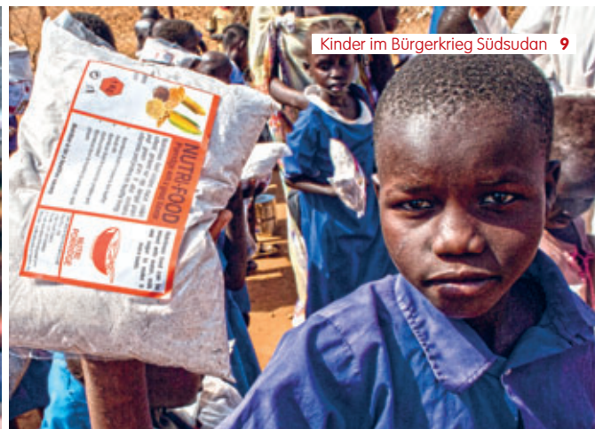
Ergänzende Lebensmittelpakete erhalten die Schulkinder von den DMI-Schwester.