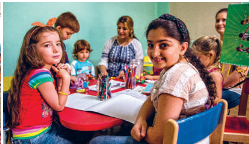
Betreute Freiräume – in denen Kinder malen und basteln. Während die Eltern in der Sozialstation die Angebote nutzen, sind die Kinder gut aufgehoben.