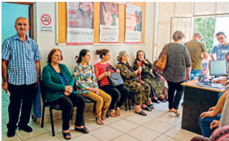
Sozialstation Hashmi – zu der vor allem irakische Flüchtlinge kommen, um Gutscheine, medizinische und psychosoziale Hilfen zu erhalten.