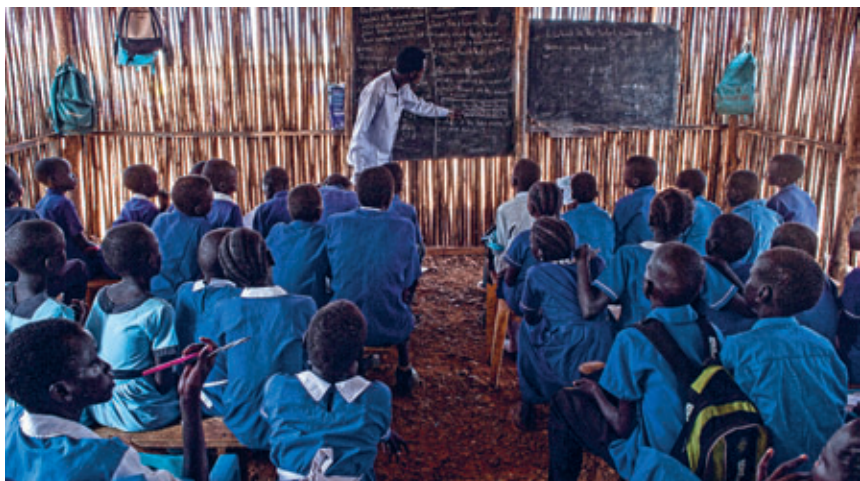
Einfachst aber so wichtig: Die Schule der DMI-Schwestern im Lager der Hauptstadt Juba, die Caritas international unterstützt.