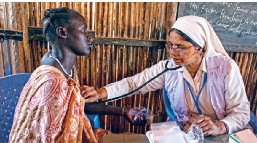
Am der Schule wird eine Arztpraxis: Die DMI-Schwester leisten auch medizinische Hilfe - unterstützt von Caritas international.